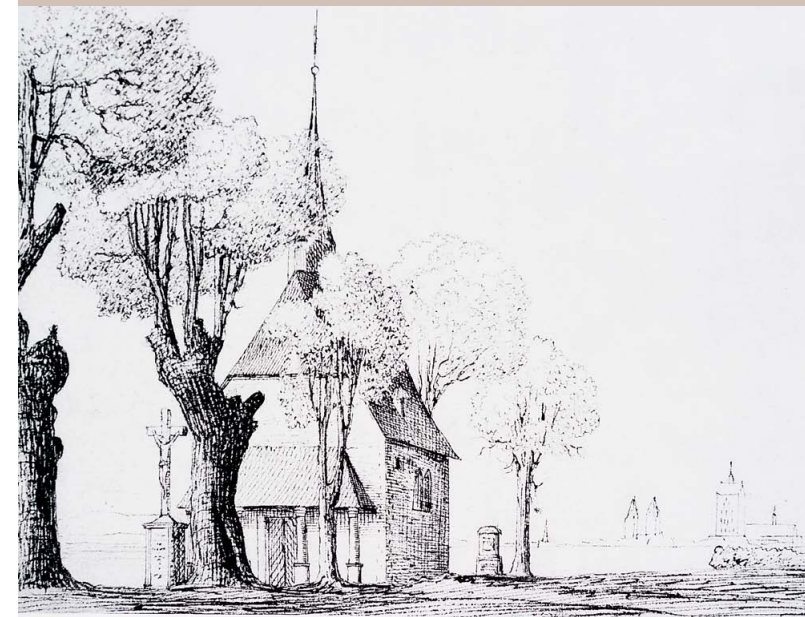
„Die römische Capelle“, Federzeichnung v. F. J. Brand, um 1820/1830 Verein für Geschichte und Altertumskunde, Paderborn