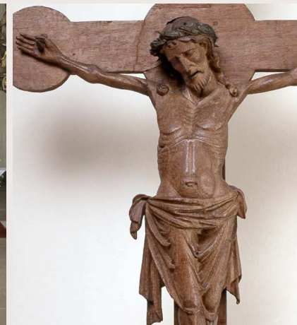
Kruzifix mit Reliquiendeponitorium, um 1280