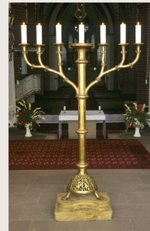
Siebenarmiger Leuchter, um 1300

Auf die Jerusalemtradition verweist noch ein siebenarmiger Standleuchter aus Messing, der heute im Chor hinter dem Altar steht. Er ist um 1300 entstanden, 2,15 m hoch und auf seinem halbkugeligen Fuß sind Tiere dargestellt (vgl. Abb.). Ferner befindet sich in der Sakristei ein Eichenholzkreuz aus dem ausgehenden 13. Jahrhundert (vgl. Abb.), das vermutlich einst im Triumphbogen