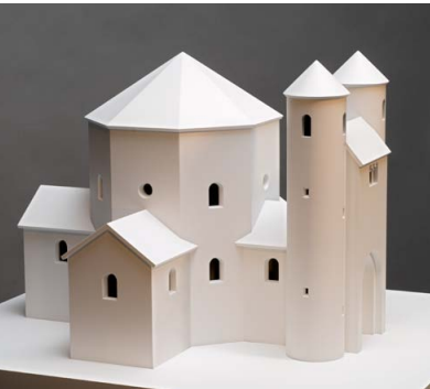
Modell der Kirche St. Petrus und Andreas, genannt Busdorf, Kopie des Heiligen Grabes zu Jerusalem, 2. Hälfte 11. Jahrhundert, Diözesanmuseum Paderborn

In der ersten Hälfte des 11. Jahrhunderts war Paderborn Sitz eines der mächtigsten Bischöfe des damaligen ostfränkisch-deutschen Reiches. Der aus sächsischem Adelsgeschlecht stammende Bischof Meinwerk (1009–1036) prägte mit seiner Bautätigkeit das Bild der Stadt bis in die heutige Zeit.