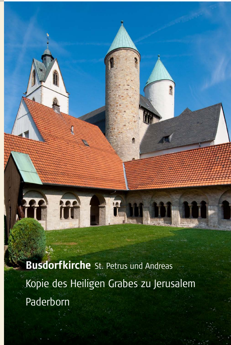
Busdorfkirche St. Petrus und Andreas

PILGERN ZU HEILIGEN STÄTTEN IM ERZBISTUM PADERBORN